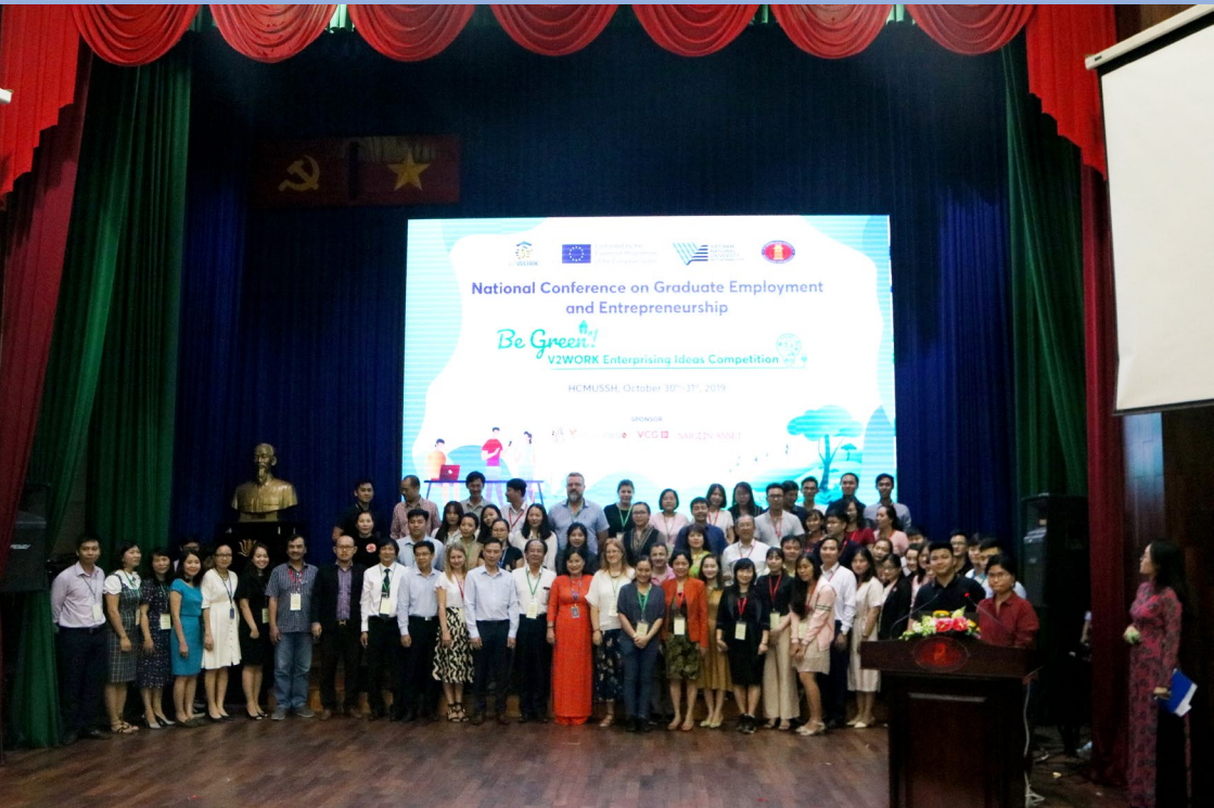
Các thành viên tham dự Hội thảo Quốc gia