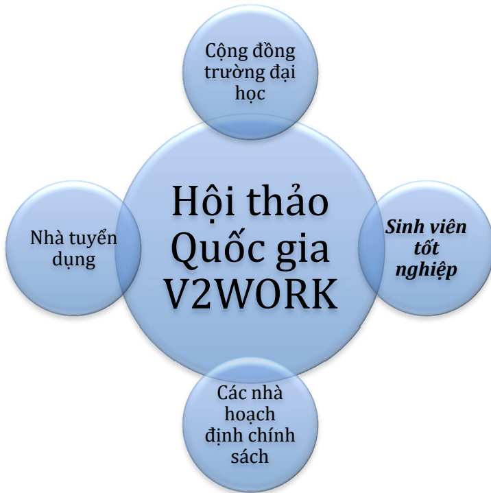
Hình 2: Thành phần tham gia quan trọng trong Hội thảo Quốc gia tại USSH

Hội thảo Quốc gia tại Thành phố Hồ Chí Minh thu hút nhiều thành phần tham gia từ cộng đồng các trường đại học (nhà quản lý, giáo sư, nhân viên trung tâm hướng nghiệp, và sinh viên), sinh viên đã tốt nghiệp, nhà tuyển dụng, nhà hoạch định chính sách và các cơ quan giới thiệu việc làm. Đây là cơ hội đặc biệt để các đối tượng khác nhau cùng nhau thảo luận về các vấn đề liên quan đến việc làm như: sự không tương thích giữa năng lực của sinh viên mới ra trường và nhu cầu của nhà tuyển dụng, quá trình chuyển tiếp từ trường học sang thị trường lao động, hoặc hệ sinh thái khởi nghiệp tại Việt Nam.